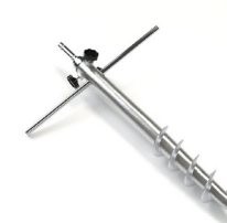
MATP 06 / Pieux à visser

Taille : 60 cm Utilisation extérieur (sable, terre & neige) Acier inoxydable Prix: 38€ HT