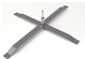
MATP 04 / Croisillon acier

Taille : 83x73 cm Poids : 4 kg Utilisation intérieur/extérieur Acier peint gris Prix: 45 HT