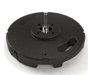
MATP 02 / Bloc béton

Taille : 45x45 cm Poids : 10 kg Utilisation intérieur/extérieur Béton recouvert de PVC Prix: 49€ HT