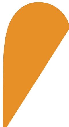
FF 110 Forme goutte d'eau 56 x 106 cm