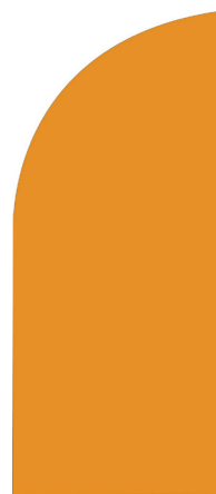
WF 120 Forme arrondie 54 x 120 cm