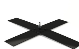
MATP 05 / Croisillon acier

Taille : 70x85 cm Poids : 15 kg Utilisation intérieur/extérieur Acier peint gris Prix: 110€ HT