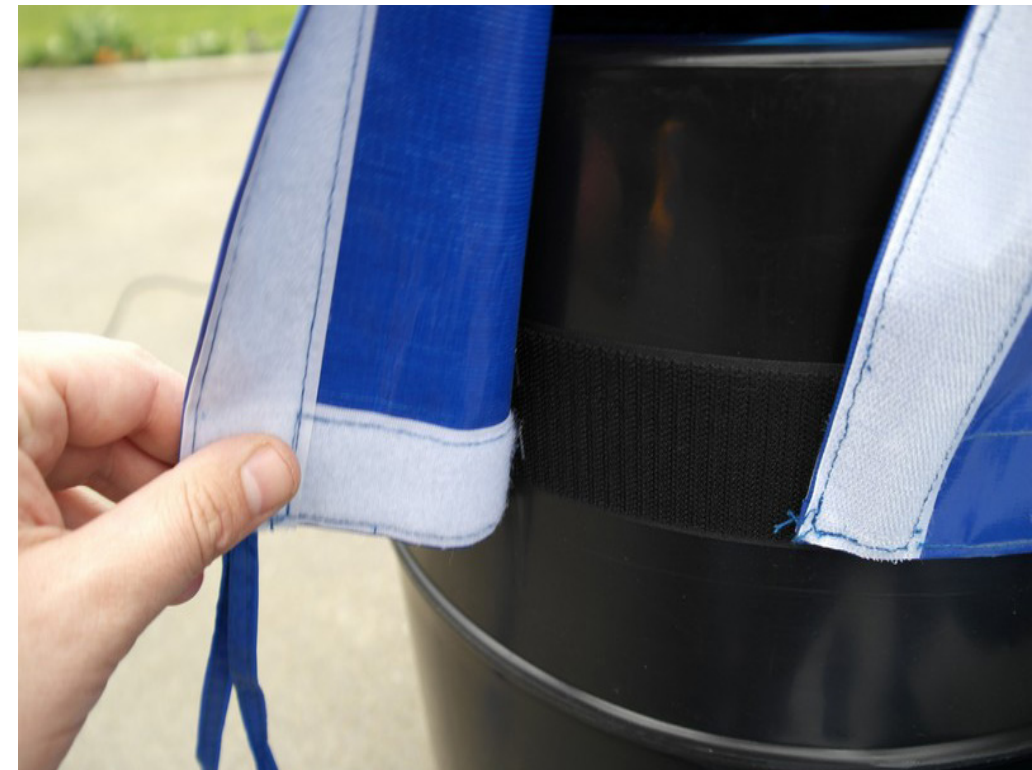
Système d'attache velcro de la toile du skydancer sur la soufflerie

Remise quantitative: 2 unités = 5% / 3 unités = 7% / 4 unités = 10% / au-delà = sur devis