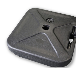
MATP 03 / Socle à eau

Taille : 59x59 cm Poids : 25L Utilisation intérieur/extérieur PVC noir avec roulettes Prix: 75€ HT