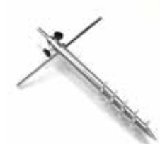
MATP 06 / Pieux à visser

Taille : 60 cm Utilisation extérieur (sable, terre & neige) Acier inoxydable Prix: 38€ HT