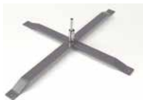
MATP 04 / Croisillon acier

Taille : 83x73 cm Poids : 4 kg Utilisation intérieur/extérieur Acier peint gris Prix: 54€ HT