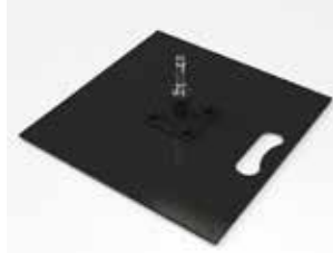
MATP 01 / Plaque acier

Taille : 40x40 cm Poids : 5 kg ou 10 kg Utilisation intérieur/extérieur Acier inoxydable noir Prix: 53€ HT / 79€ HT