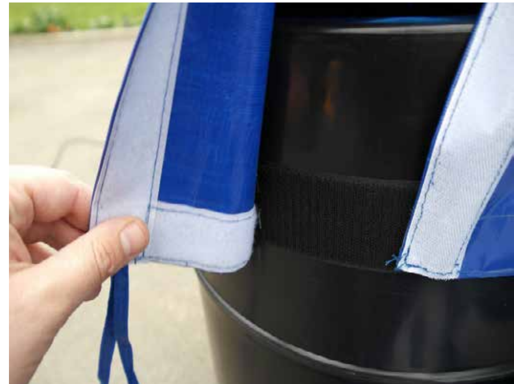
Système d'attache velcro de la toile du skydancer sur la soufflerie

Remise quantitative: 2 unités = 5% / 3 unités = 7% / 4 unités = 10% / au-delà = sur devis