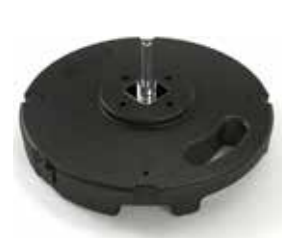
MATP 02 / Bloc béton

Taille : 45x45 cm Poids : 10 kg Utilisation intérieur/extérieur Béton recouvert de PVC Prix: 40€ HT