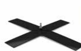
MATP 05 / Croisillon acier

Taille : 70x85 cm Poids : 15 kg Utilisation intérieur/extérieur Acier peint gris Prix: 110€ HT