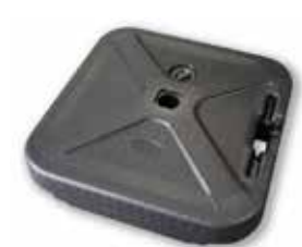
MATP 03 / Socle à eau

Taille : 59x59 cm Poids : 25L Utilisation intérieur/extérieur PVC noir avec roulettes Prix: 50€ HT